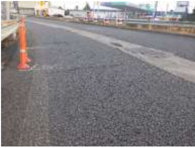
鹿沼IC出口ランプ 舗装損傷状況