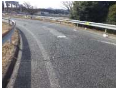
宇都宮IC出口ランプ 舗装損傷状況