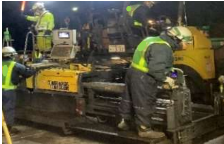
舗装補修工事 作業状況

安全・快適に高速道路をご利用いただくために必要な工事ですので、ご理解とご協力をお願いします。