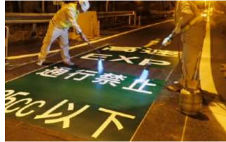
逆走対策工事 作業状況