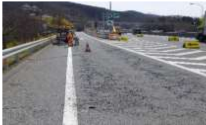
舗装損傷状況 現状

そのため、お客さまへ極力ご迷惑をおかけしないよう、交通量が少ない平日の夜間にランプの閉鎖を行い、工事を集中的かつ効率的に実施します。安全・快適に高速道路をご利用いただくために必要な工事ですので、ご理解とご協力をお願いします。