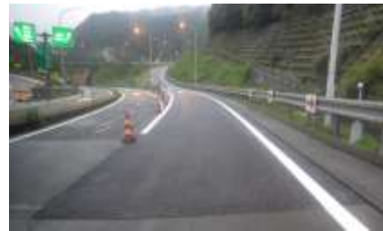
舗装補修完了イメージ