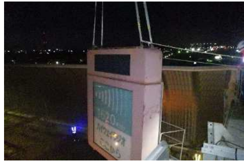
始点案内標識板 撤去作業状況