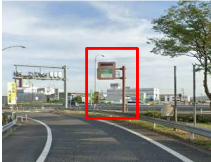
始点案内標識板 現地状況

そのため、お客さまへ極力ご迷惑をおかけしないよう、交通量が少ない平日の夜間にランプの閉鎖を行い、工事を集中的かつ効率的に実施します。安全・快適に高速道路をご利用いただくために必要な工事ですので、ご理解とご協力をお願いします。