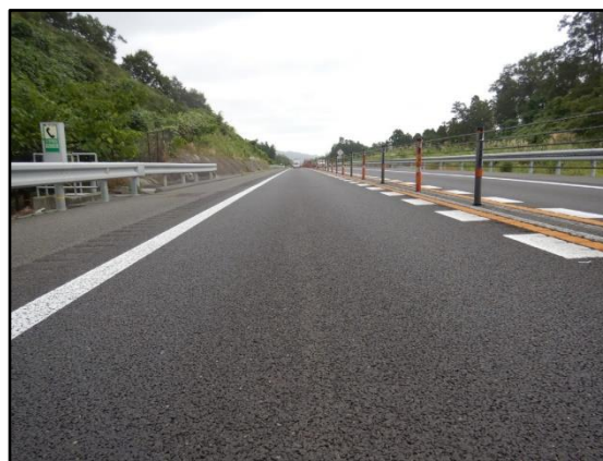
舗装補修後イメージ