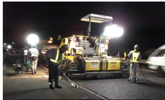
舗装工事 作業状況