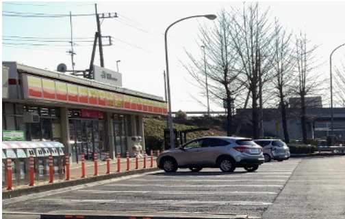
黒磯PA 駐車場・歩道段差状況

そのため、お客さまへ極力ご迷惑をおかけしないよう、交通量が少ない平日の夜間にPAの閉鎖を行い、工事を集中的かつ効率的に実施します。安全・快適に高速道路をご利用いただくために必要な工事ですので、ご理解とご協力をお願いします。