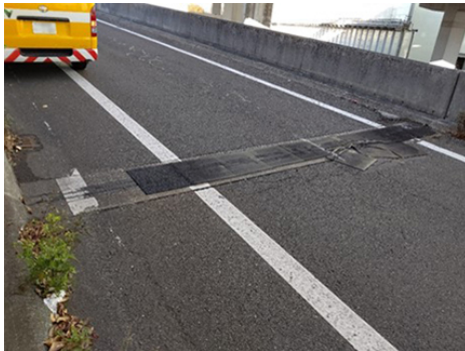
伸縮装置の損傷状況

安全・快適に高速道路をご利用いただくために必要な工事ですので、ご理解とご協力をお願いします。