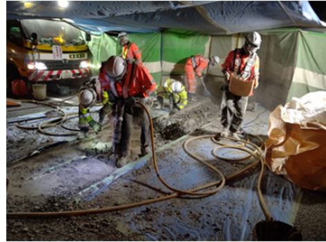
伸縮装置取替工事 作業状況