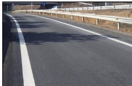
補修完了状況(イメージ)