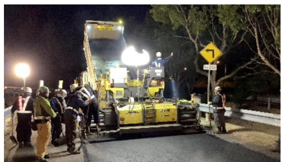
舗装補修工事 作業状況