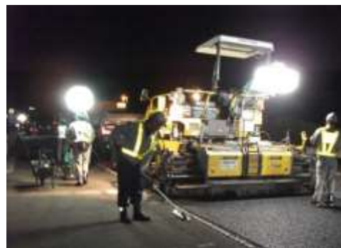
夜間舗装補修工事 作業状況