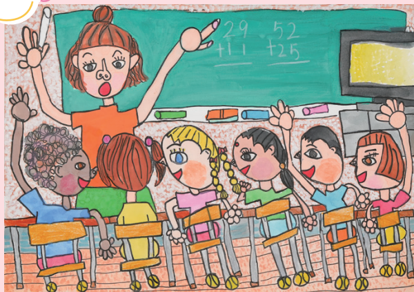
「先生になってたくさんべん強教えるよ!!」 上越市立 大瀧町小学校 2年生