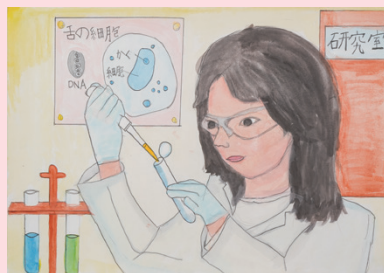
「私の夢は薬の研究者」 上越市立 有田小学校 3年生