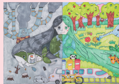
「地球を抱きしめて、未来を守ろう」 国立大学法人 上越教育大学附属小学校 4年生