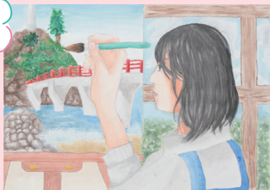
「画家として活躍」 糸魚川市立 大和川小学校 6年生