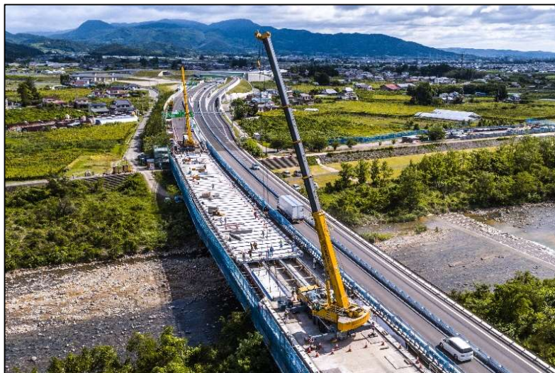
【対面通行規制状況】