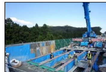
【古い床版撤去状況】