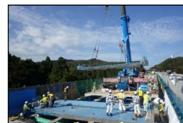
【新しい床版設置状況】