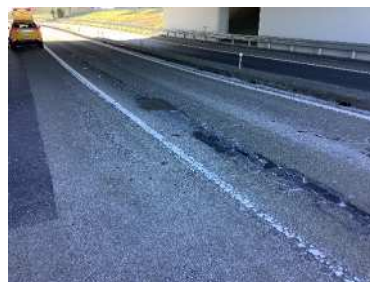
栃木ICランプ 舗装損傷状況