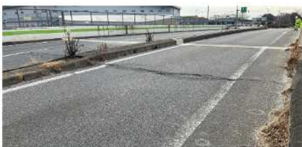
佐野藤岡ICランプ 舗装損傷状況

安全・快適に高速道路をご利用いただくために必要な工事ですので、ご理解とご協力をお願いします。