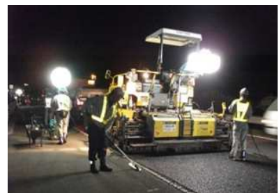
舗装補修工事 作業状況