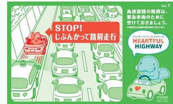
路肩は緊急車両のために 空けておきましょう！