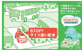
自分の車のサイズに合った 駐車マスに停めましょう！