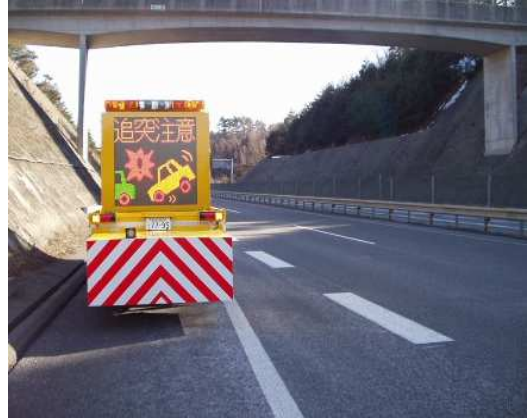
②渋滞末尾への追突注意喚起