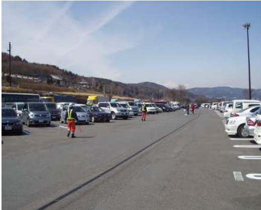
③休憩施設などでの駐車場整理員の配置