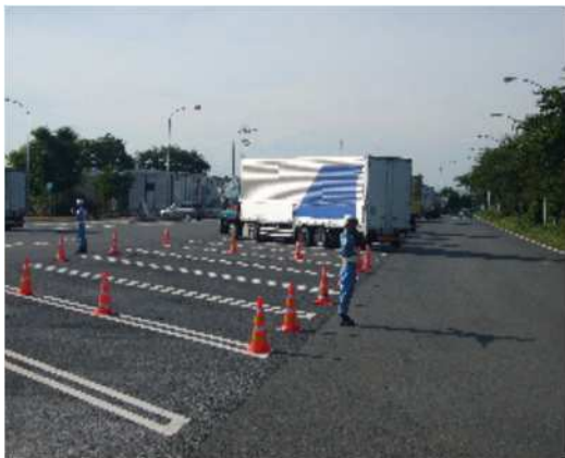
⑤大型車駐車マスの確保