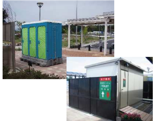
④臨時トイレの設置