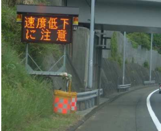
①上り坂などでの速度低下注意喚起