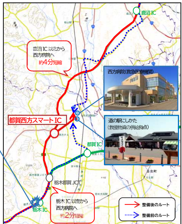
地理院地図(国土院) (https://maps.gsi.go.jp/)をもちに、栃木市が加工