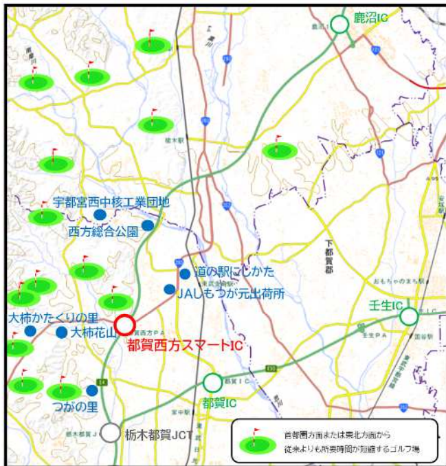
地理院地図(国土院) (https://maps.gsi.go.jp/)をもちに、栃木市が加工

開通に伴い、都賀西方スマートIC周辺施設等へのアクセス時間短縮により工業振興、農業振興による地域活性化が期待されます。また、周辺ゴルフ場へのアクセスや都賀・西方地域内の新たな周遊ルート形成による観光振興も期待できます。