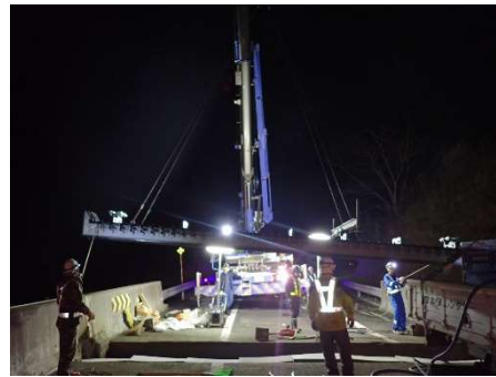
伸縮装置取替工事 作業状況