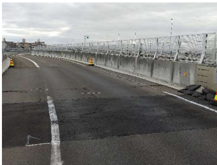
伸縮装置損傷状況

そのため、お客さまへ極力ご迷惑をおかけしないよう、昼夜連続のランプの閉鎖を行い、工事を集中的かつ効率的に実施します。安全・快適に高速道路をご利用いただくために必要な工事ですので、ご理解とご協力をお願いします。