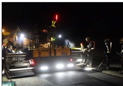
舗装補修工事 作業状況写真