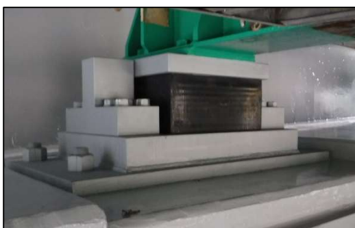
耐震補強工事 支承取替状況

そのため、お客さまへ極力ご迷惑をおかけしないよう、交通量が少ない平日の夜間にランプの閉鎖を行い、工事を集中的かつ効率的に実施します。安全・快適に高速道路をご利用いただくために必要な工事ですので、ご理解とご協力をお願いします。