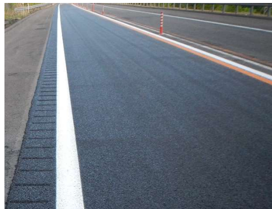
舗装補修工事 作業完了後イメージ