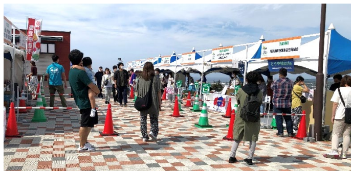
令和4年度実施の様子