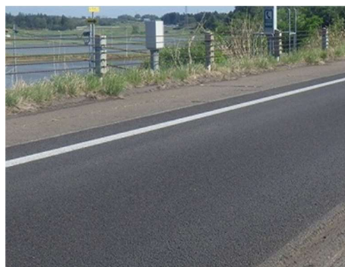
補修完了状況(イメージ)