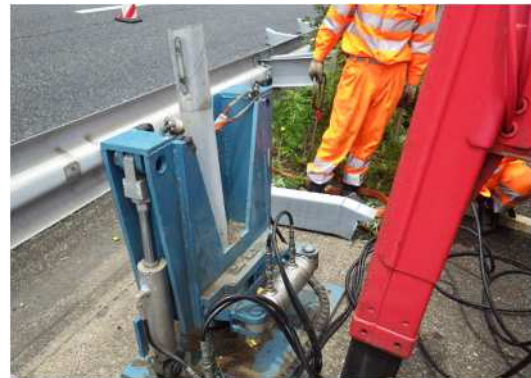
防護柵補修工事 作業状況