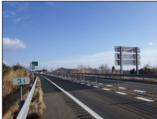
舗装補修後イメージ