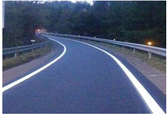
舗装補修後(イメージ)