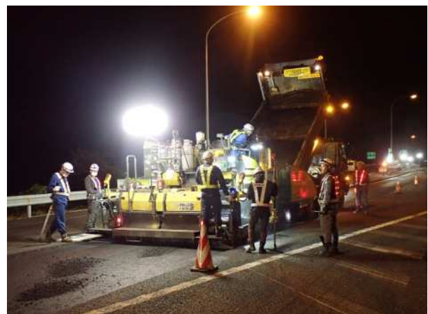
舗装補修工事 作業状況