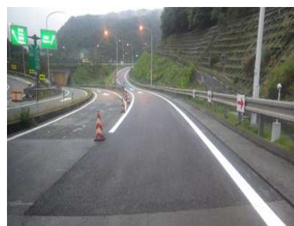
舗装補修完了イメージ