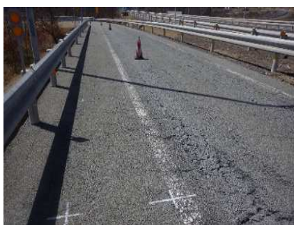
路面損傷状況 現状

そのため、お客さまへ極力ご迷惑をおかけしないよう、交通量が少ない平日の夜間にランプの閉鎖を行い、工事を集中的かつ効率的に実施します。安全・快適に高速道路をご利用いただくために必要な工事ですので、ご理解とご協力をお願いします。