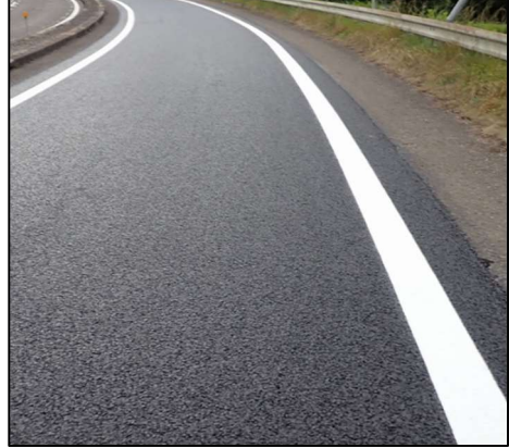
舗装補修完了状況(イメージ)