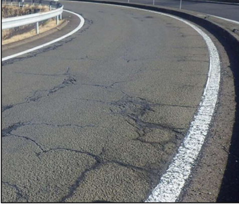
舗装損傷状況(イメージ)

そのため、お客さまへ極力ご迷惑をおかけしないよう、交通量が少ない平日の夜間にランプの閉鎖を行い、工事を集中的かつ効率的に実施します。安全・快適に高速道路をご利用いただくために必要な工事ですので、ご理解とご協力をお願いします。