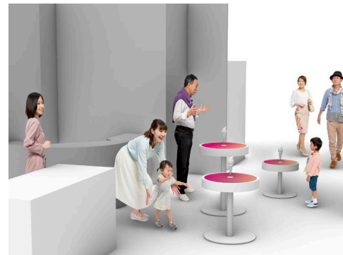
[2] Magical soft ice (マジカルソフトクリーム)