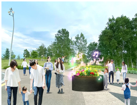
[1] サウンドガーデニング

会場内の花壇では触れると様々な音楽を奏でるサウンドガーデニング [1] 、店舗内ではソフトクリームを使って楽しむことのできるインタラクティブな光の作品 [2] 、芝生エリアでは光のインスタレーション [3] により、お客さまが思わず導かれるような仕掛けをお楽しみいただけます。