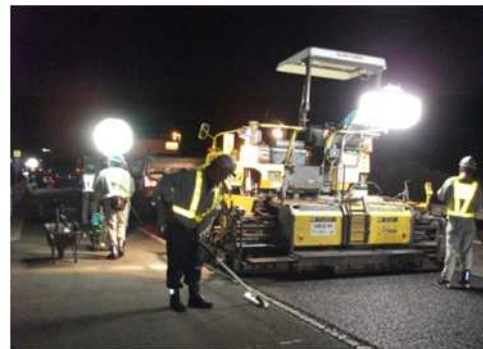
夜間舗装補修工事 作業状況