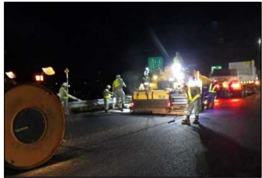
舗装補修工事 作業状況