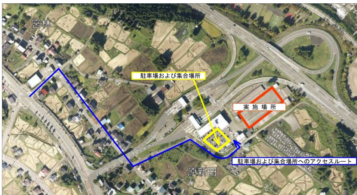
地理院タイルに追記して記載

【実施場所】 関越自動車道 湯沢IC内の管理用敷地 〒949-6102 新潟県南魚沼郡湯沢町大字神立1159