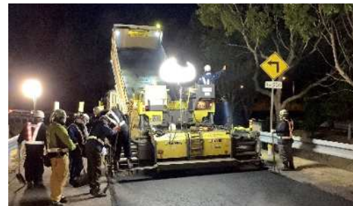
舗装補修工事 作業状況