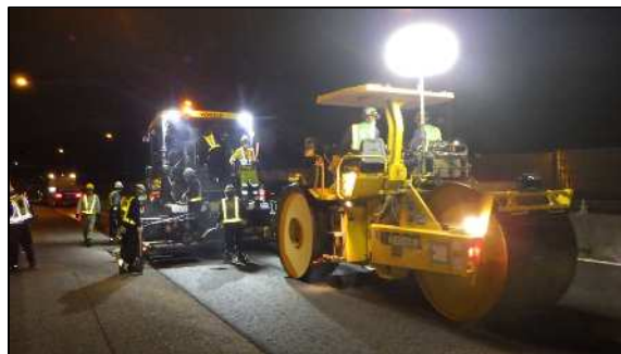
舗装補修工事 作業状況