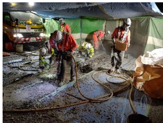
伸縮装置取替工事 作業状況