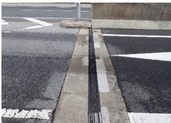
伸縮装置損傷写真

そのためお客さまへ極力ご迷惑をおかけしないよう、交通量が少ない平日の夜間にランプの閉鎖を行い、工事を集中的かつ効率的に実施します。安全・快適に高速道路をご利用いただくために必要な工事ですので、ご理解とご協力をお願いします。