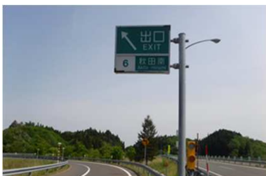
ランプ内標識板 遠景

そのため、お客様へ極力ご迷惑をおかけしないよう、交通量が少ない平日の夜間にランプの閉鎖を行い、工事を集中的かつ効率的に実施します。安全・快適に高速道路をご利用いただくために必要な工事ですので、ご理解とご協力をお願いします。