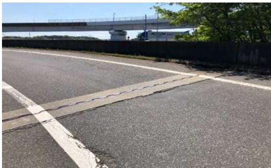
伸縮装置損傷状況

そのため、お客さまへ極力ご迷惑をおかけしないよう、交通量が少ない平日の夜間にランプの閉鎖を行い、工事を集中的かつ効率的に実施します。安全・快適に高速道路をご利用いただくために必要な工事ですので、ご理解とご協力をお願いします。