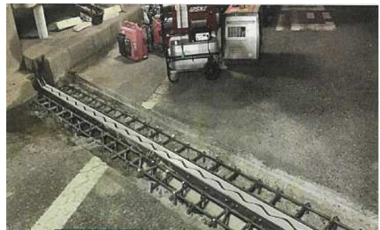
伸縮装置取替工事 作業状況