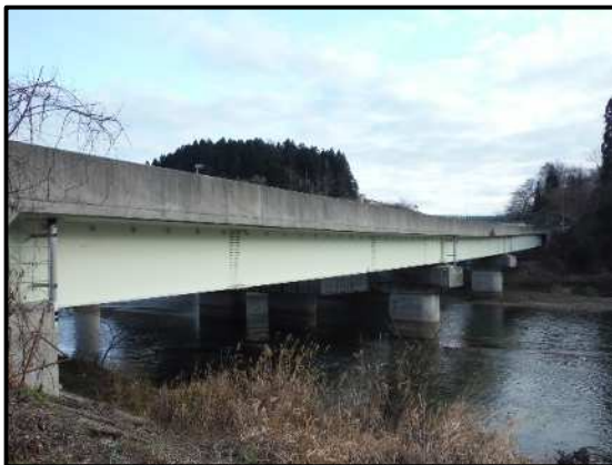
耐震補強工事 対象橋梁