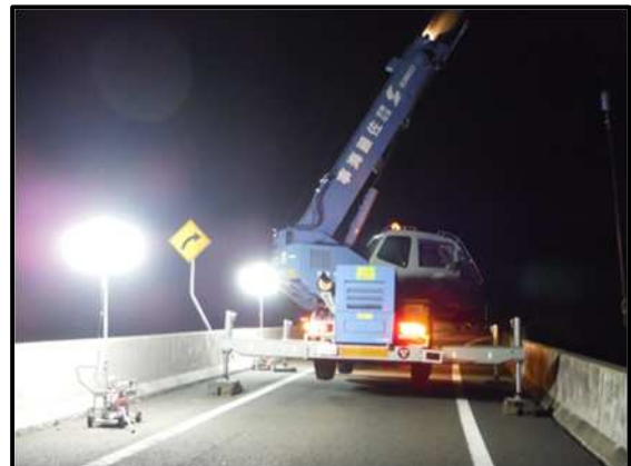
耐震補強工事 足場解体