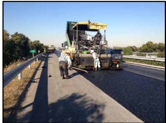
舗装補修工事 作業状況写真