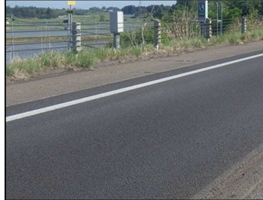
舗装補修完了状況(イメージ)