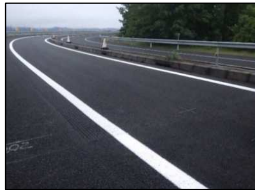
舗装 補修後イメージ