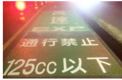
逆走対策工事 完成状況