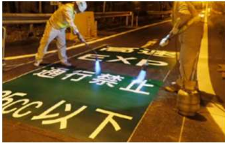
逆走対策工事 作業状況

安全・快適に高速道路をご利用いただくために必要な工事ですので、ご理解とご協力をお願いします。