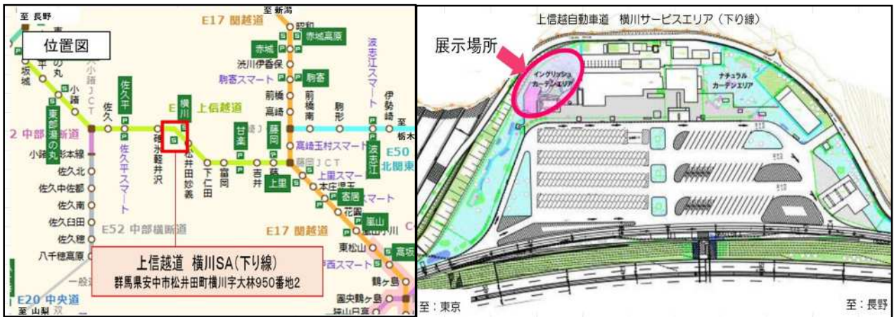
【イングリッシュガーデンエリア拡大図】