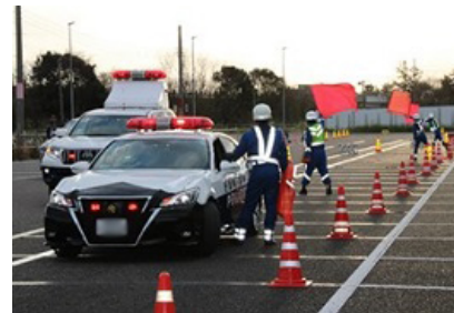
高速隊と交通管理隊の合同対応