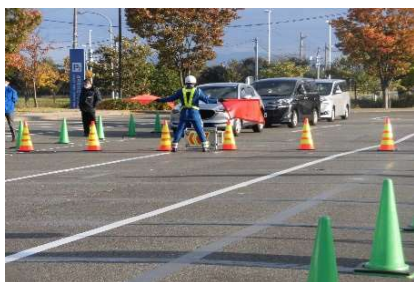
交通管理隊による交通規制