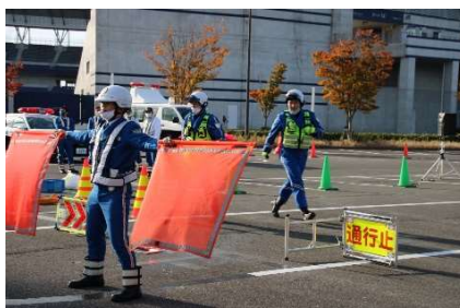
規制器材を活用した本線閉鎖