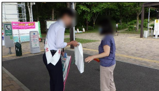
SA・PAにおけるノベルティ配布