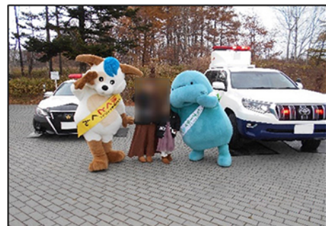
マナーティと一緒に