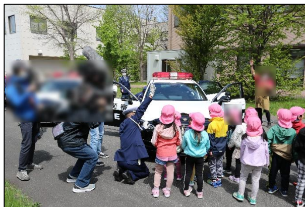
乗車体験会イメージ