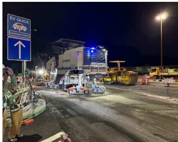
バリアフリー工事 作業状況

東北道 上り線 都賀西方PAの入口ランプにおいて、バリアフリー工事に伴う舗装のかさ上げ工事を実施します。工事実施にあたって通常の車線規制や駐車場の利用制限では施工ができないことから、PAを閉鎖して作業を行う必要があります。そのため、お客さまへ極力ご迷惑をおかけしないよう、交通量が少ない平日の夜間にPAの閉鎖を行い、工事を集中的かつ効率的に実施します。 安全・快適に高速道路をご利用いただくために必要な工事ですので、ご理解とご協力をお願いします。