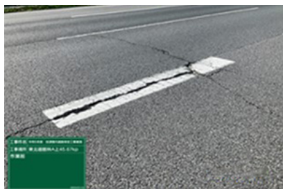
館林IC舗装損傷状況

工事実施にあたって通常の車線規制では施工が出来ないことから、ランプを閉鎖して作業を行う必要があります。そのため、お客さまへ極力ご迷惑をおかけしないよう、交通量が少ない平日の夜間にランプの閉鎖を行い、工事を集中的かつ効率的に実施します。安全・快適に高速道路をご利用いただくために必要な工事ですので、ご理解とご協力をお願いします。