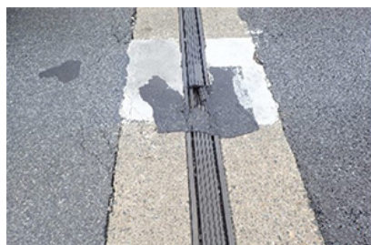
川口JCT伸縮装置損傷状況