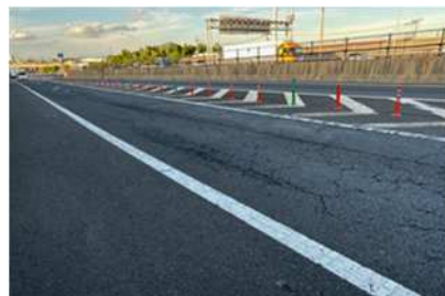
川口JCT舗装損傷状況