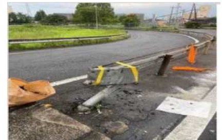
岩槻IC事故損傷状況