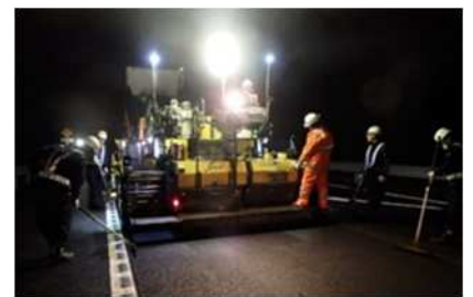
舗装補修工事 作業イメージ図