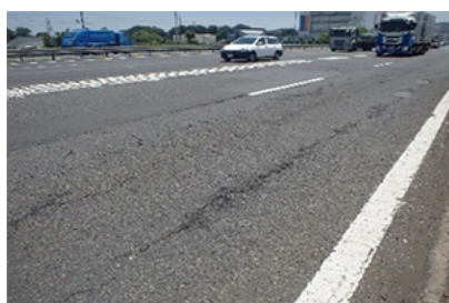
岩槻IC舗装損傷状況