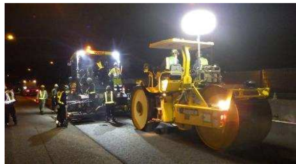
舗装補修工事 作業状況