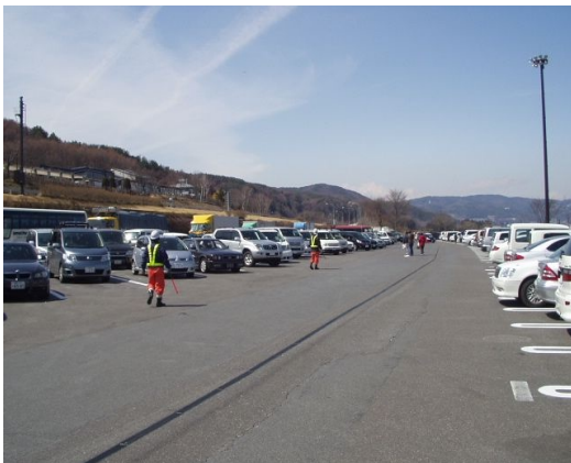
③休憩施設などでの駐車場整理員の配置