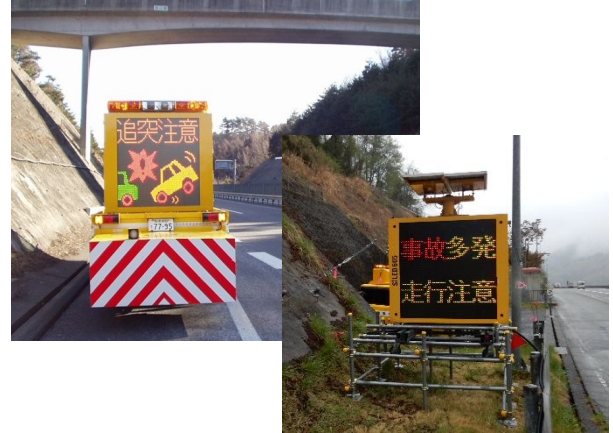
②渋滞末尾等への追突注意喚起