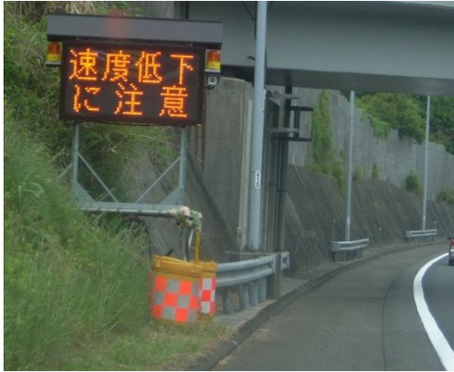
①上り坂などでの速度低下注意喚起