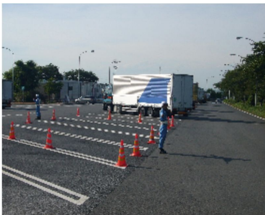
⑤大型車駐車マスの確保