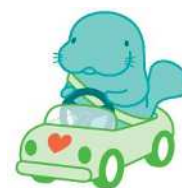
マナーアップキャラクター 「マナーティ」