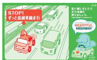
追い越し後は後方確認をおこない、 走行車線に戻りましょう！