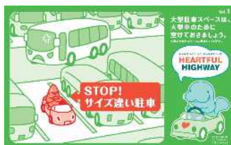
自分の車のサイズに合った 駐車マスに停めましょう！