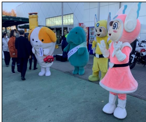
NEXCO東日本マナーアップキャラクター 「マナーティ」の参加